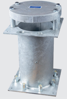
LP-1L + SS-1

JTK Power Oy:n ilmanvaihdon läpiviennit ovat sertifioituja ja täyttävät määräykset.