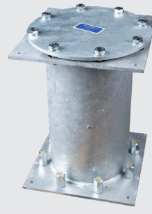
LP-1L + IS-1